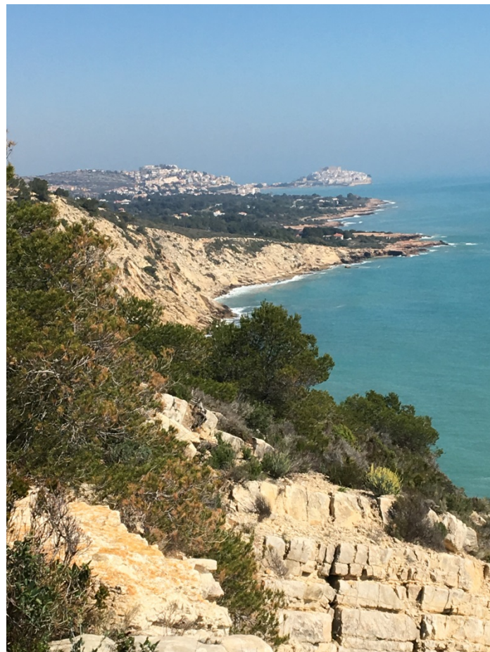
Sierra d'Irta (Peníscola)